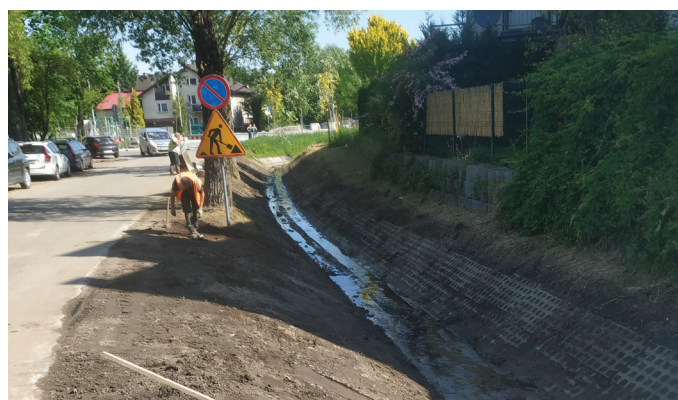
Oczyszczanie potoku Młynny Kobierzyński

Wysłuchując się w głosy mieszkańców, został zrealizowany remont przepustu w ul. Zbrojarzy na potoku Młynny Kobierzyński wraz z budową