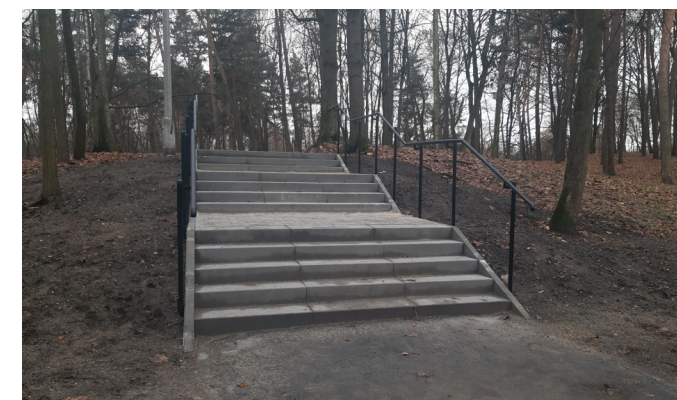
Wyremontowane schody w Parku Solvay