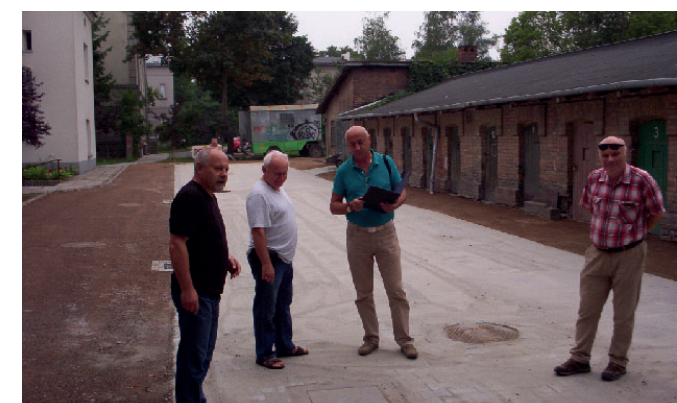
Wybrukowany dojazd do budynku przy ul. Zakopiańskiej 99