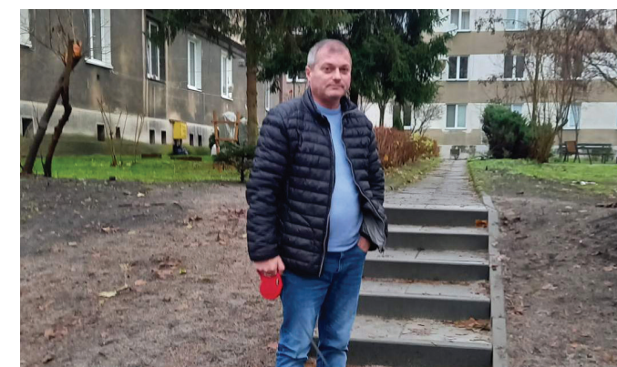
Wyremontowany chodnik przy ul. Kępnej