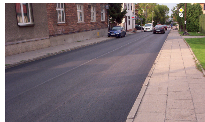
Nowa nawierzchnia przy ul. Żywieckiej

klej, Zakopiańskiej (od Orzechowej w stronę Zawilej), Żywieckiej (od Zawilej do Cesarza), Montwiłła (od Niemcewicza do Rynku Fałęckiego), Orzechowej (parking przy placu targowym)