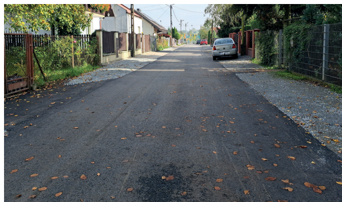
Wybudowanie kanalizacji oraz nowa nawierzchnia na ul. Falowej

pach i z dużym prawdopodobieństwem jej realizacja rozpocznie się już w przyszłym roku.