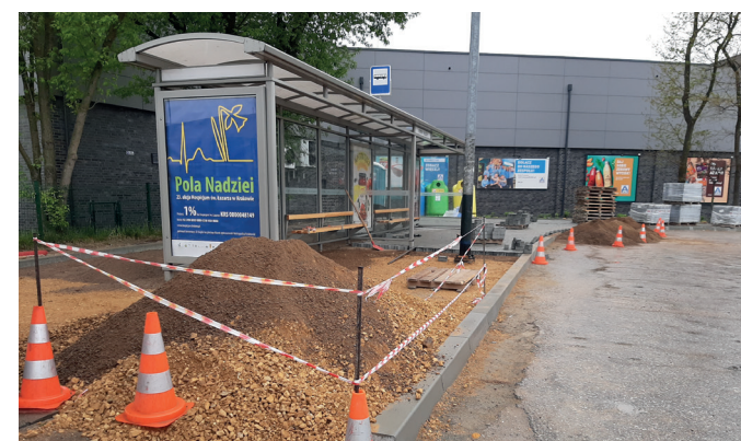
Remont przy pętli w Borku Fałęckim

• remonty chodników ulic: Zbrojarzy, Zakopiańska (od przystanku Borek Fałęcki I do Kościuszkowców oraz od Przystanku Solvay do Zbrojarzy), pętla autobusowa w Borku Fałęckim (chodnik oraz perony przystankowe).