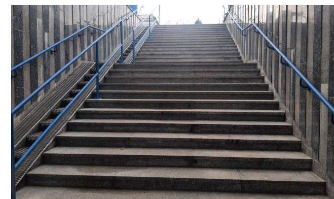
Wyremontowane przejście podziemne przy ul. Zakopiańskiej